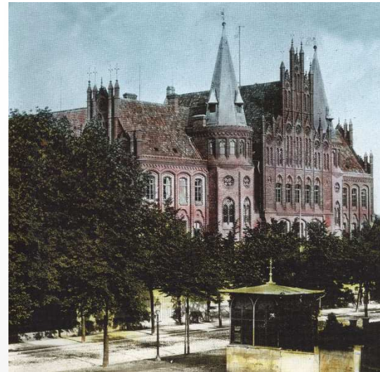
StadtA Hildesheim Best. 957 Nr. 220