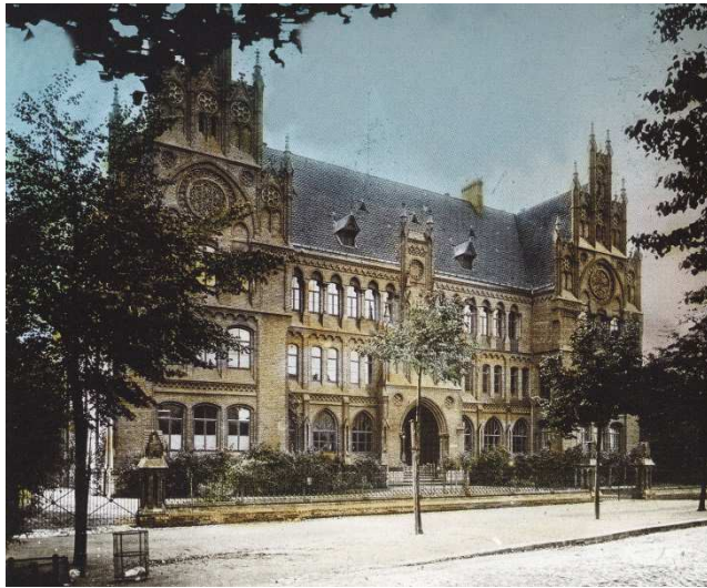
StadtA Hildesheim Best. 957 Nr. 221