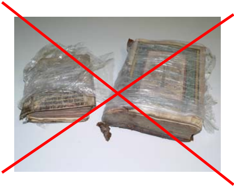
Deformierung des Buchblocks, schlechte Umwicklung